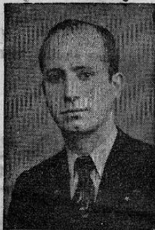
Prof. D. Uladislao Gámez Ministro de Educación Pública

para que los más urgentes problemas del momento sean solucionados pronta y eficazmente